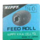
ビヤダル #46, #80, #120, #180